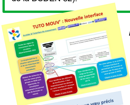
La nouvelle interface